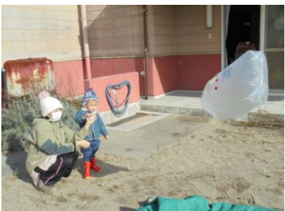
<うさぎ組:たこあげ>

きりん組ではお正月遊びとして「羽根つき」をしました。 羽子板にシールを貼り、パン食い競争のように部屋に張ったひもに高さを違わせて羽根をぶら下げ、打って遊びました。 高い所にある羽根めがけて打ったり、空振りしたり・・・。 「かるた」も体験し、日本のお正月遊びを楽しみました。