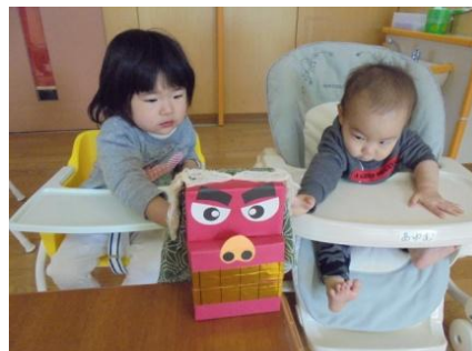
<ひよこ組:ししまい>

お正月遊びをしました。 ししまいが登場すると固まってしまう子もいましたが、そっと頭をなでることもでき1年間元気に遊べるようお願いしました。